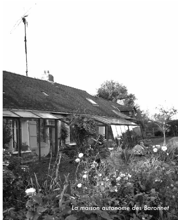
La maison autonome des Baronnet

Plus de facture d'eau depuis 32 ans, plus de facture d'électricité depuis 8 ans, plus de loyer depuis 20 ans, construire sa maison afin d'éviter de rembourser une fois et demie son prix pour nourrir les banques et travailler à deux jusqu'à la retraite (nos quatre enfants ont partagé une vie simple sur un seul demi salaire). En revanche, un savoir-faire qui s'enrichit, une confiance mêlée d'audace pour inventer sa vie en dehors des clous du prêt-à-porter culturel et technique, créer